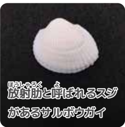
放射状と厚みがあるサルボウガイ