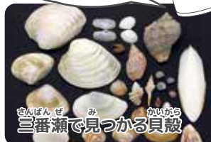
三番瀬で見つかる貝殻

皆さんも三番瀬の浜辺でお気に入りの貝殻を見つけて、工作にチャレンジしてみてください！ワークショップ『クリスマスキャンドルを作ろう』へのご参加もお待ちしております。(山口)