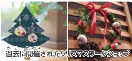
過去に開催されたクリスマスワークショップ